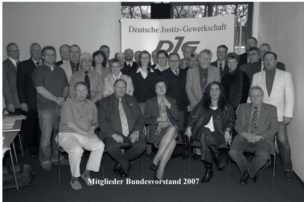
Mitglieder Bundesvorstand 2007