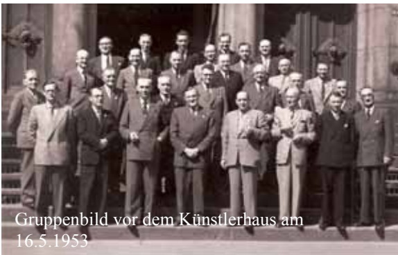
Gruppenbild vor dem Künstlerhaus am 16.5.1953

Die Verbandsgründung fand ein starkes Echo. Die Zahl der Verbandsmitglieder wuchs rasch. Viele hatten erkannt, dass nur eine starke Interessenvertretung als Gegengewicht zum öffentlichen Arbeitgeber sie ihrem Ziel für mehr soziale Gerechtigkeit näher bringen würde.