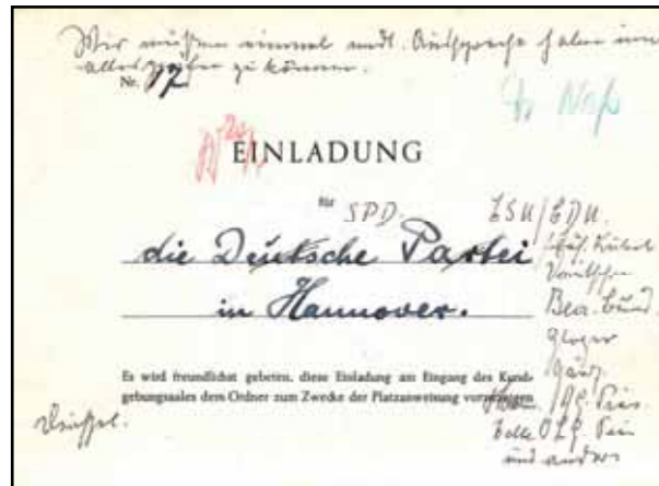
Einladung anlässlich der Bundestagung am 17.05.1953 in Hannover

Diesem Zusammenschluss schlossen sich in den Jahren 1952 die Landesverbände Hamburg, Hessen, Bayern und Rheinland-Pfalz an. Berlin 1953, Bremen 1954, und schließlich folgte das Saarland im Jahre 1958.